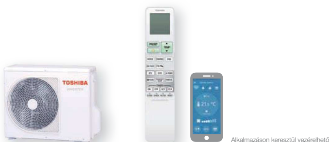
Kültéri egység (jelképes ábra)